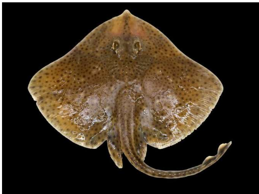
Blonde rog (Raja brachyura)

Dit project analyseert de informatie vanuit de Belgische visserijactiviteiten die nuttig kunnen zijn voor het internationaal biologisch onderzoek en het visserijmanagement. De Belgische visserij kan enkel betrouwbare data genereren voor stekelrog en blonde rog, de aanwezigheid van andere soorten zijn onvoldoende representatief. Het overlevingspercentage ligt op 70%. Eindrapport nog niet beschikbaar.