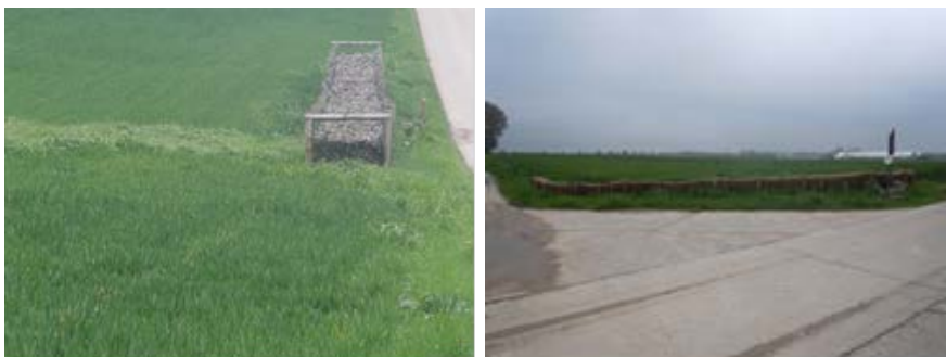
Afbeelding 7 : aanleg van dammetjes ter voorkoming van erosie