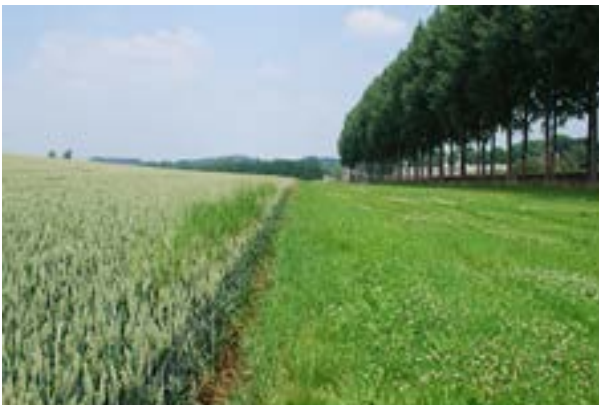
Afbeelding 3: grasbufferstrook