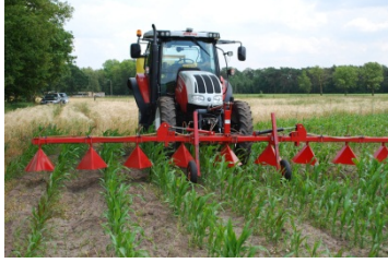
Afbeelding 9: rijenbehandeling tegen onkruid in maïs