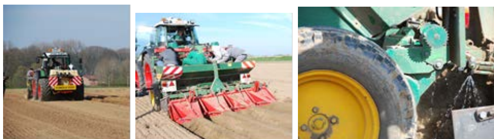
Afbeelding 5 : rijenbemesting bij planten een aanaarden van aardappelen

Bemesting is bij voorkeur gebaseerd op een chemische bodem- of gewasanalyse die op regelmatige tijdstippen minstens om de 4-5 jaar uitgevoerd wordt. Het gebruik van aangepaste technieken om de voedingsbehoefte te bepalen is aangeraden. De MAP normen moeten gerespecteerd worden. Het toepassen van specifieke technieken om gericht en efficiënter te bemesten wordt aanbevolen (vb band-, rij- of puntbemesting of traag werkende meststoffen).