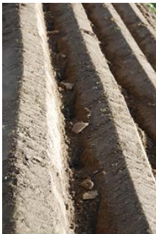
Afbeelding 6 : aanleg van drempeltjes tussen de aardappelryggen