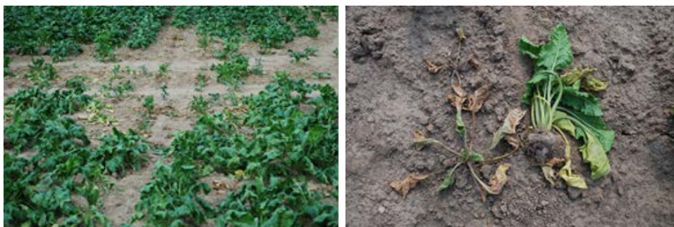
Afbeelding 4 : aantasting van Rhizoctonia voorkomen doot een gepaste rassenkeuze

Om problemen met ziekten en plagen te voorkomen is het belangrijk om de teelt te starten met gezond plant- en/of zaadgoed. Wanneer plantmateriaal geleverd wordt, doet u een visuele controle op de aanwezigheid van ziekten en plagen. Gebruik gezond plantmateriaal, zaaigoed of gecertificeerd uitgangsmateriaal. Als u hoeveepootgoed of eigen gekweekt zaad gebruikt, doe dan een strenge controle tijdens de teelt en vóór het uitplanten of zaaien op aanwezigheid van ziekten en plagen.