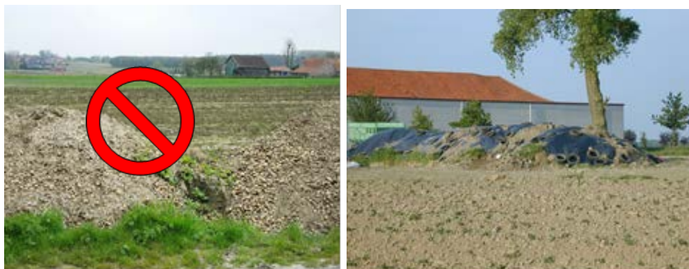
Afbeelding 8 : niet afgedekte afvalhoop ↔ afgedekte afvalhoop

Door gepaste maatregelen zoals bij voorbeeld afdekken kan de verspreiding van ziekten en plagen vanuit hopen met plantaardige afval voorkomen worden. Vermijd groei van aardappelloof op de afvalhopen.