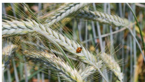
Afbeelding 12 : lieveheersbeestje in granen