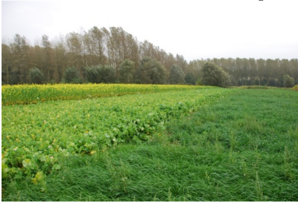
Afbeelding 2: Inzaai verschillende groenbedekkers