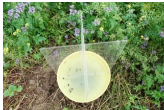
Afbeelding 10: gele opvangbak voor waarnemingen van nuttige organismen o.a. in bloemenranden