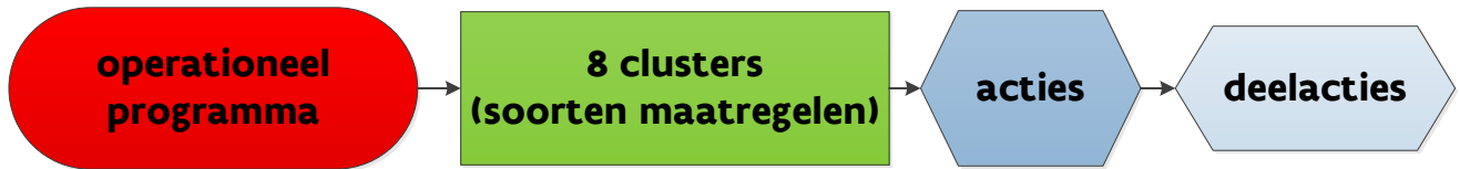
Figuur 1: Structuur van operationeel programma clusters/acties/deelacties

Elke actiecluster kan verder opgedeeld worden en ingevuld worden met verschillende categorieën van acties en deelacties. Voor de concrete invulling van deze clusters en acties wordt voldoende ruimte gelaten aan de creativiteit van de producentenorganisaties of unies.