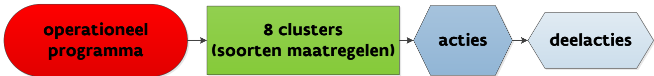
Figuur 1: Structuur van operationeel programma clusters/acties/deelacties

Een programma moet coherent en evenwichtig opgebouwd zijn. Dit evenwicht wordt geëvalueerd over de looptijd van het programma, nl. 5 jaar. Eventuele minima en maxima, zoals in de verordening of in deze strategie opgenomen, moeten elk jaar nagekomen worden, tenzij anders aangegeven.